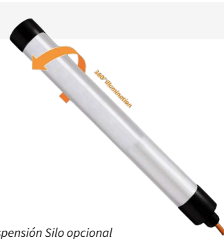
Suspensión Silo opcional